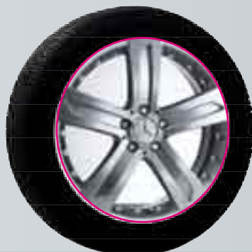
Klemola | Cerchio a 5 razze

B6 647 4212; L'utilizzo di catene da neve non è possibile.