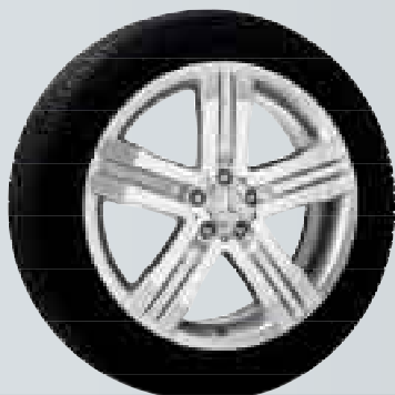
Furud | Cerchio a 5 razze