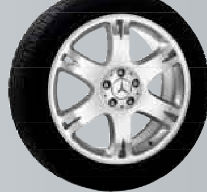
Rukbat | Cerchio a 6 razze