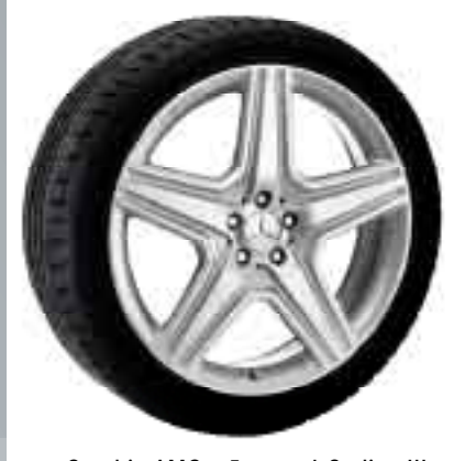
Cerchio AMG a 5 razze | Styling III

Cerchio in lega AMG | Superficie: argento, tornita a specchio