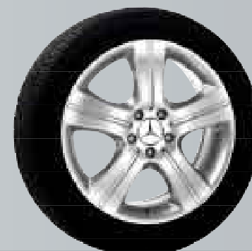
Mintaka | Cerchio a 5 razze

B6 647 4368; L'utilizzo di catene da neve non è possibile.