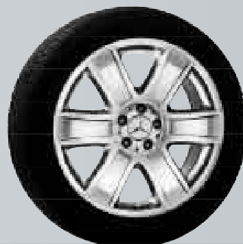
Alrai | Cerchio a 6 razze