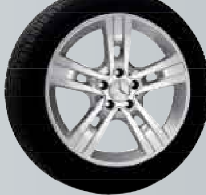
Gyas | Cerchio a 5 razze

Sfogliate le prossime pagine per scoprire altre emozioni.