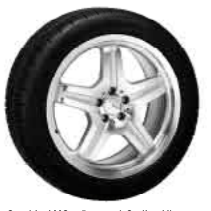
Cerchio AMG a 5 razze | Styling VI

Dimensioni: 9 J x 21 ET 48 | Pneumatici: