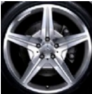
Cerchi da 19" (770)