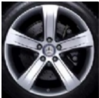
Cerchi da 18 (R31)