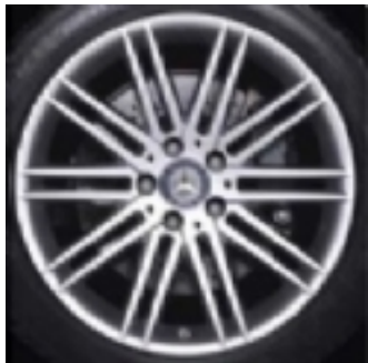
Cerchi da 18" (R99)