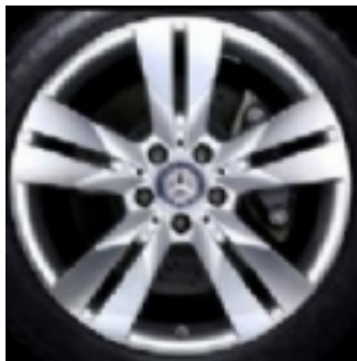
Cerchi da 18 (22R)