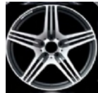
Cerchi da 19" (797)