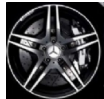
Cerchi da 19" (793)