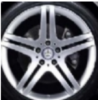
Cerchi da 19 (R17)